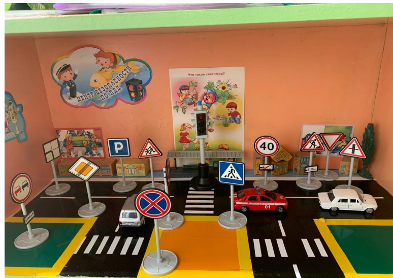
Фото на странице: 0